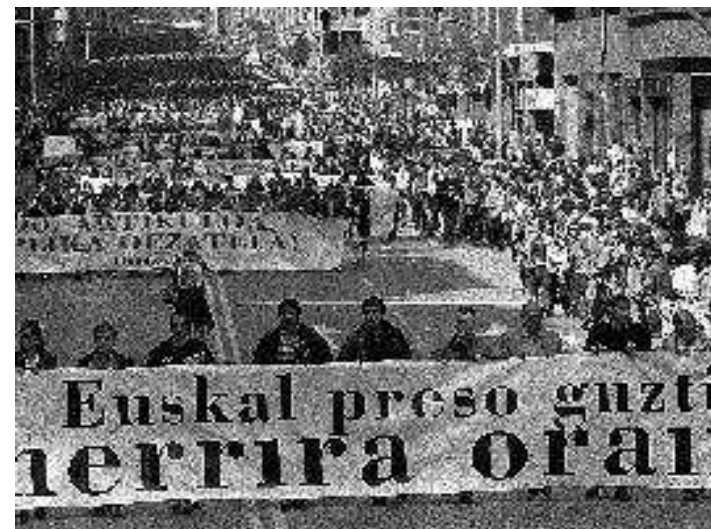
El País, 6.04.98