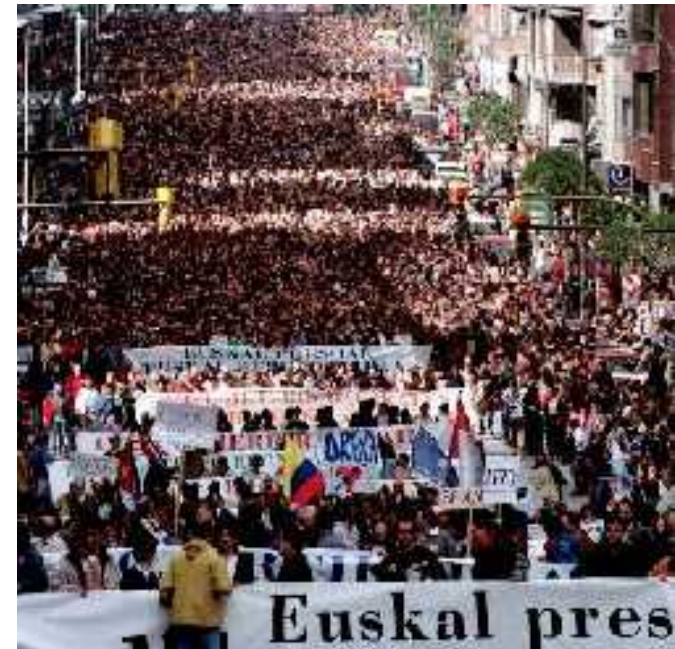
El Periódico, 6.04.98