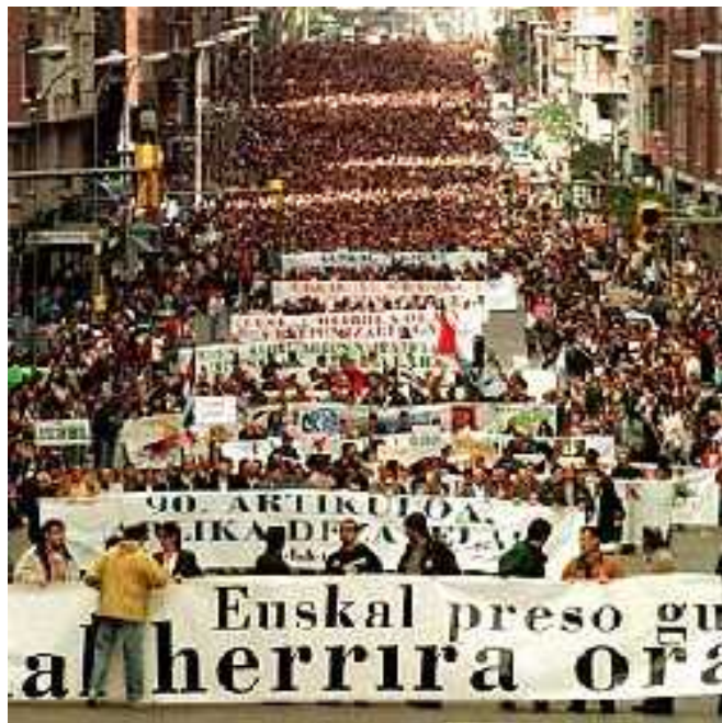
El Mundo, 5.04.98